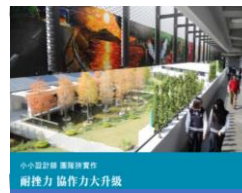
創意思光：讓好點子帶你站上寬闊的世界舞台 創意研發課程引導學子創新思維